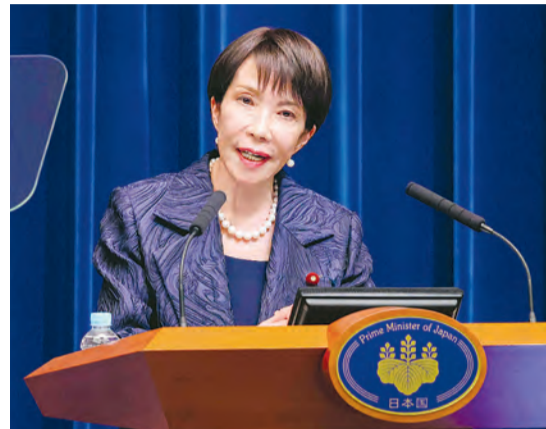
就任後、初の記者会見に臨む高市首相