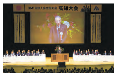
第41回法人会全国大会 高知大会

公益財団法人全国法人会総連合(斎藤保会長)は16日、高知県立県民文化ホールで、第41回法人会全国大会(高知大会)を開催したII写真。